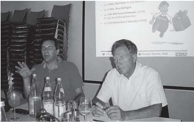
Dr. Joachim Pfeiffer MdB (links) und Norbert Barthle MdB.