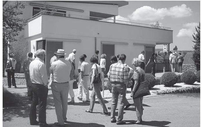
Besuch des Schwörer-Hauses.