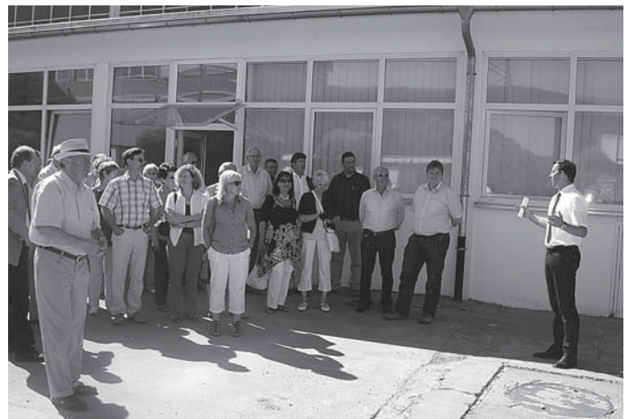
Rundgang durch die Fa. Kemmler.

waren die Produktionshallen sowie die eingesetzten modernen Fertigungsverfahren unter Einsatz modernster digitaler Technik.