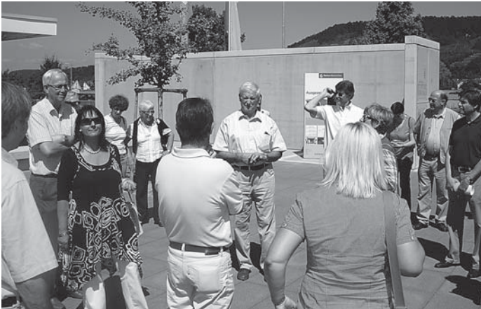
Rundgang durch die Fa. Kemmler.