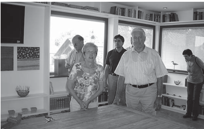
Besuch des Schwörer-Hauses.