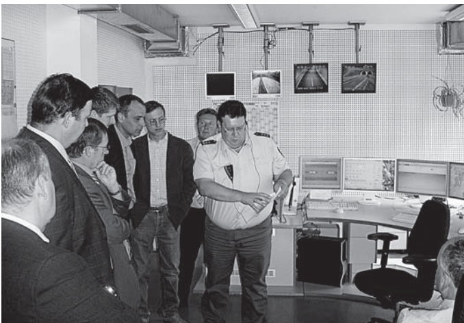
In der Leitzentrale.