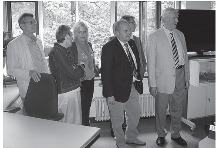
In der Leitzentrale.