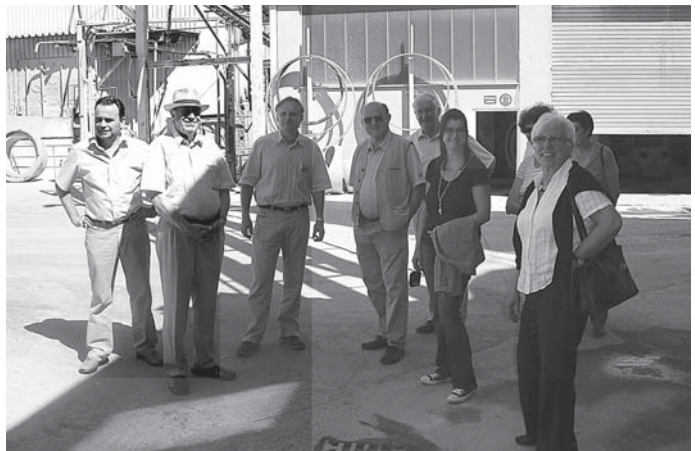
Rundgang durch die Fa. Kemmler.