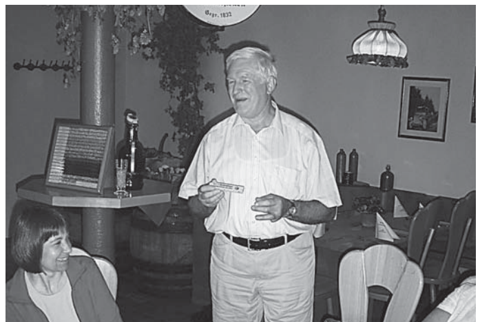
KHM Wöhr dankt den Organisatoren der Infofahrt.